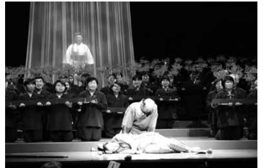
▶合唱オペラ「ごんぎつね」