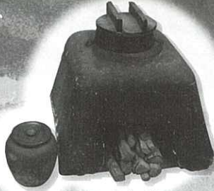
かまどと火消し壺